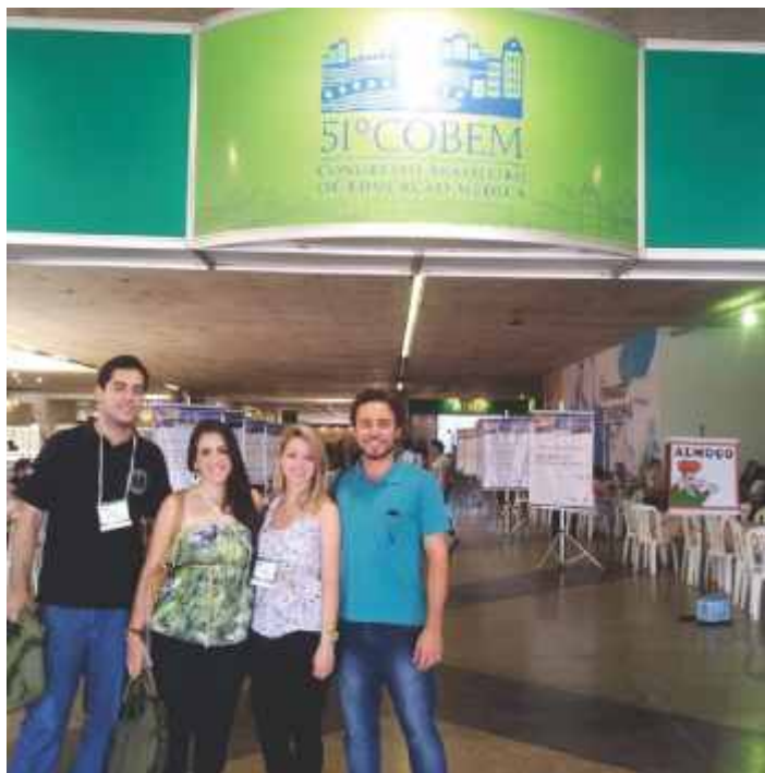
Alunos integrantes do DADEC

do tema central supracitado, com cinco conferências atreladas aos turnos dos três dias de congresso bem como plenária final, o que culminou na participação de todos os congressistas nas discussões da ampla temática abordada. Temática esta que agregou todas as atividades do Congresso aos objetivos da ABEM.