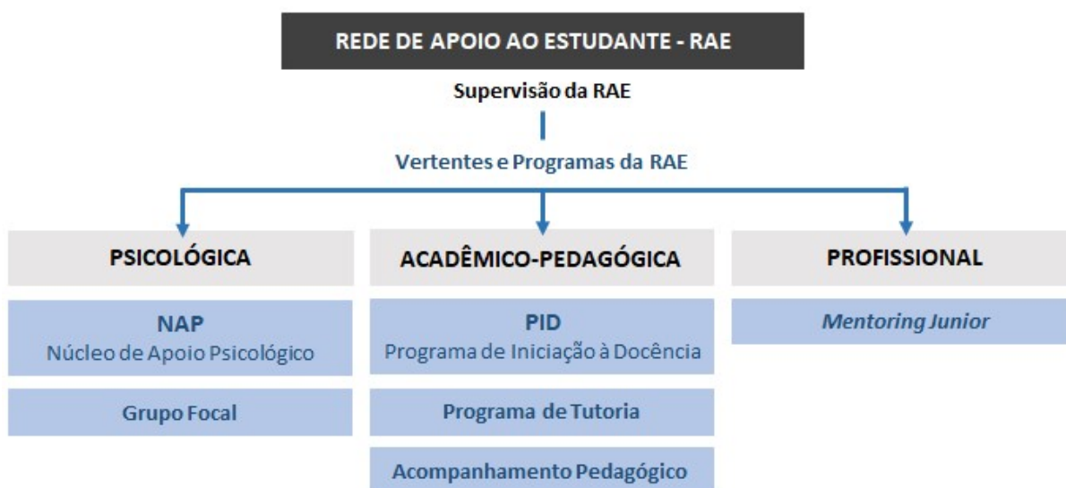
Figura 2 - Vertentes e Programas da Rede de Apoio ao Estudante da FAME.

A Rede de Apoio ao Estudante é composta pelos seguintes núcleos principais ( Figura 2 ): Programa de Tutoria, Programa de Iniciação à Docência (PID), Mentoring Junior (Mentoria), Apoio Pedagógico, Núcleo de Apoio Psicológico (NAP) e Grupo Focal. A apresentação sistemática da Rede aos alunos é feita logo no início do curso, durante a “Semana de Acolhimento aos Calouros”. A Rede segue três vertentes: (1) orientação psicológica, (2) orientação acadêmico-pedagógica e (3) orientação profissional, sendo dirigida por uma equipe multidisciplinar, composta por quatro professores-tutores, três psicólogas, uma pedagoga e diversos Assessores Acadêmicos da FAME.