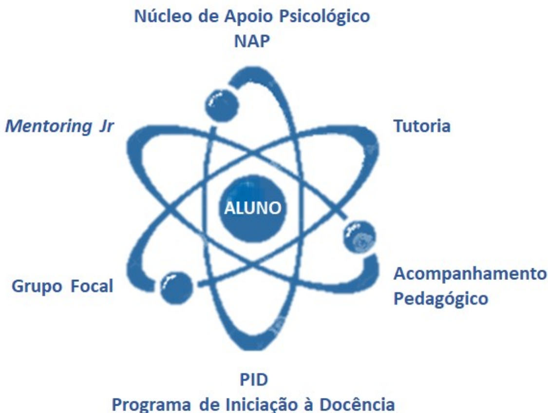
Figura 1 - O aluno é o centro da Rede de Apoio ao Estudante da FAME.

A Rede de Apoio ao Estudante de Medicina da FAME tem o intuito de promover o acolhimento e desenvolver ações de valorização da qualidade de vida e do bem-estar do aluno, ao longo da sua trajetória acadêmica, além de propor atividades que contribuam para o seu melhor desempenho nos estudos, complementando e aperfeiçoando seu processo de aprendizagem escolar. Para alcançar esses objetivos, o aluno assume posição central na Rede , assim como o núcleo de um átomo, sendo circundado por programas que prestam atendimento multidisciplinar ( Figura 1 ) para auxiliá-lo a lidar com dificuldades de aprendizagem, emocionais e situações de estresse, angústia e ansiedade, entre outras questões que possam surgir durante o curso.