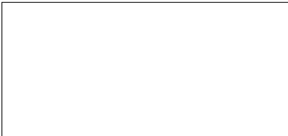
Figura 3: Legenda.....